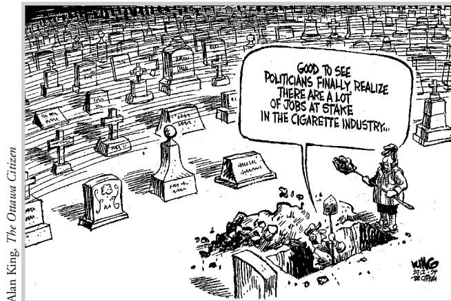
Enfin! Les politiciens ont compris que l'industrie du tabac crée beaucoup d'emplois.