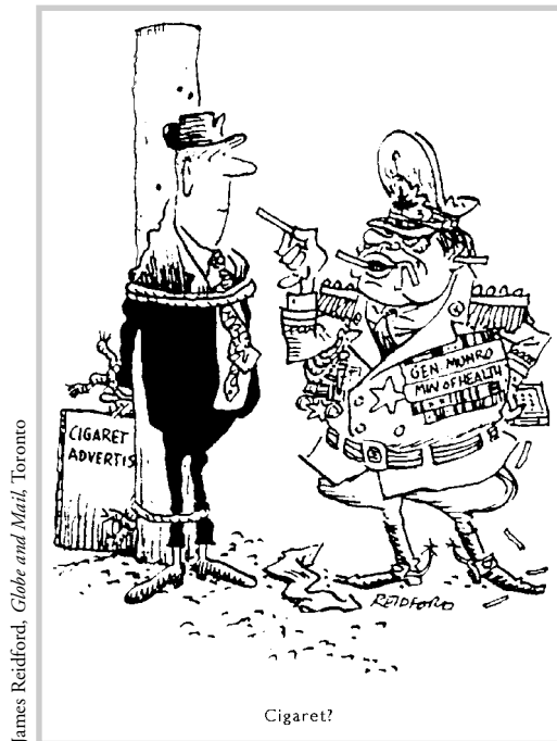
Cigarette? [ Publicité sur la cigarette ; Général Munro, ministre de la Santé ]